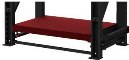
層板 891W x 604D x 65.5H mm