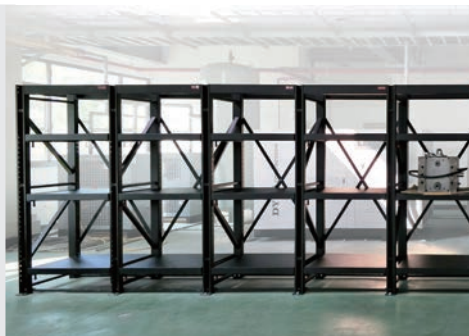
擴充層架可延伸更多儲物空間