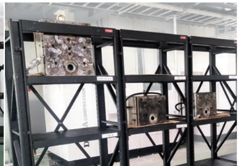
模具存儲架使用情況