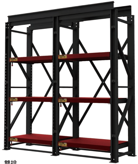
雙排 2110W x 688D x 2105H mm