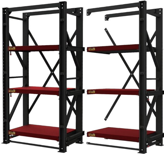
單排 1110W x 688D x 2105H mm